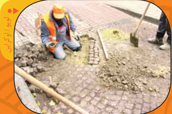
لویو / اوکراین

کارگران در شهر لویو (کشور اوکراین) در حال چیدن سنگ‌فرش خیابان هستند. شما الگوی هندسی این سنگ‌فرش را توصیف کنید.