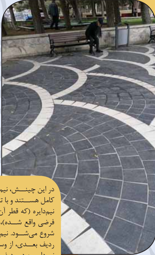
بکو / آذربایجان

سنگ‌فرش‌هایی که در آن‌ها کمان‌هایی از دایره با چیدن تکه‌های سنگ تشکیل می‌شوند، در شهرهای مختلف به صورت‌های مختلف است. ساختار هندسی آن‌ها با یکدیگر شباهت‌ها و تفاوت‌هایی دارد.