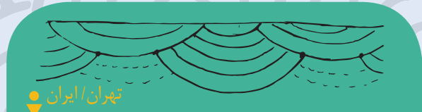
تهران / ایران