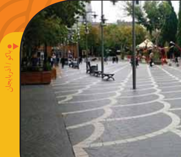
بکو / آذربایجان